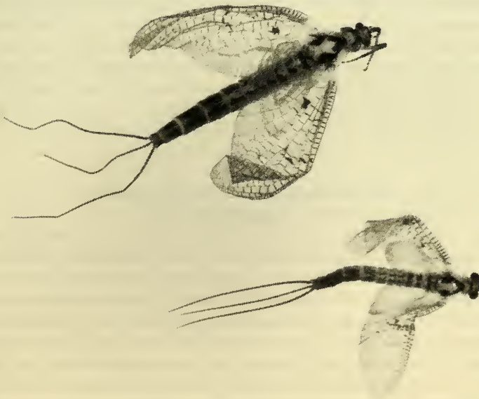
Abb. 1: Ephemera lineata Eaton, 1870. Oben Weibchen, unten Männchen. Frisch gehäutete Imagonalstadien. Dorsalansicht.

In Kallmünz an der Naab (15./16.8.1987, 1. Indiv., leg. Sauer; 17./18.8.1987, 25 Indiv., leg. Burmeister) konnten Subimagines und Imagines von Ephemera lineata Eaton, 1870 neben solchen von Ephemera danica Müller, 1764 in großer Zahl beobachtet werden. Die Naab, in diesem Abschnitt sicher